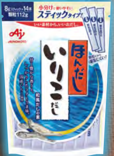
ほんだし いりこだし 国産いわしの いりこ粉末を使用