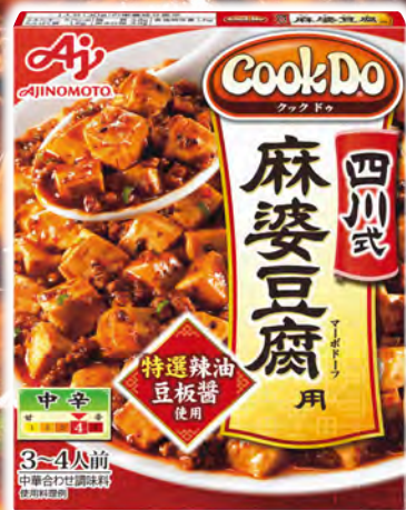
四川式麻婆豆腐用