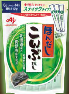
ほんだし こんぶだし 北海道産真昆布 粉末を使用