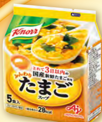
ふんわりたまごスープ