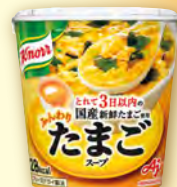
ふんわりたまごスープ 容器入