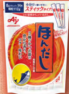
ほんだし。 香り高い3種の かつお節を使用