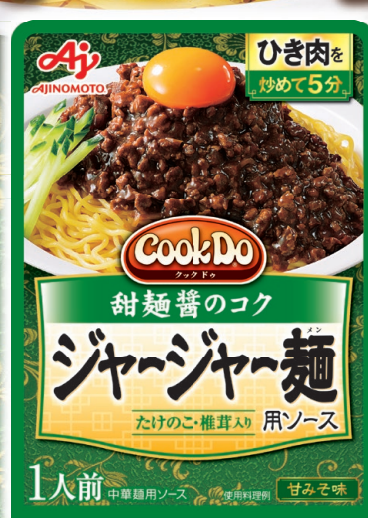
ジャージャー麺用