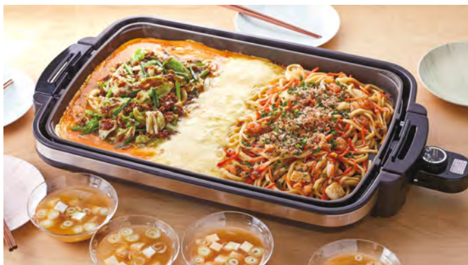
ニッポンを元気にする、味の素(株)の応援メニュー「勝ち飯®」スタジアム

味の素(株)は、「勝ち飯®」メニューを通じて、 東京2020オリンピック・パラリンピックを応援しています。