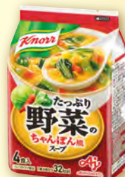
たっぷり野菜の ちゃんぽん風スープ