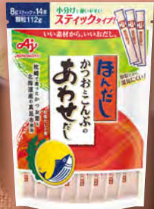
ほんだし かつおとこんぶのあわせだし かつお節と真昆布を バランスよく配合