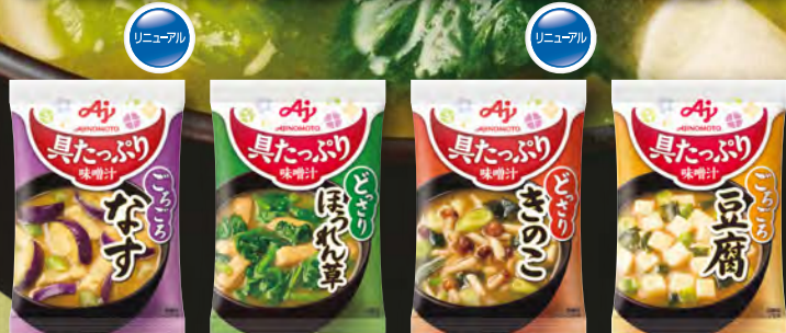
なす ほろれん草 きのみ 豆腐