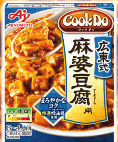
広東式麻婆豆腐用