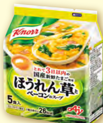
ほうれん草と ベーコンのスープ